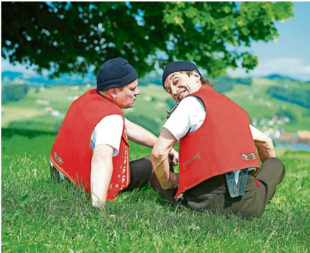
Das Comedy-Duo Messer und Gabel.