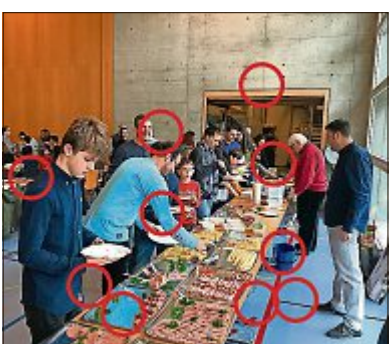
Auflösung der letzten Ausgabe

Das linke Bild ist das Original, im rechten haben sich 10 Fehler eingeschlichen. Finden Sie diese und schicken Sie das Bild, mit den eingekreisten Fehlern, bis nächsten Montag an: Bodensee Nachrichten, Marktplatz 4, Haus Münzhof, 9400 Rorschach (Absender nicht vergessen). Unter den richtigen Einsendungen wird ein/e Gewinner/in ausgelost und erhält 30 Franken in bar. Der Gewinn kann an den Werktagen abgeholt werden.